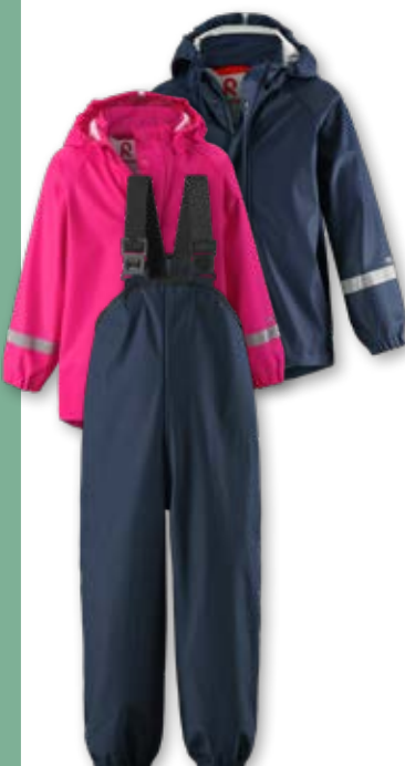
Die Regenjacke Lampi und Regenhose Lammiko von Reima halten auch die härtesten Pfützenspringer trocken.

Reima präsentiert drei Spielideen für nasskaltes Herbstwetter. Das passende Outfit gibt es auch gleich zu gewinnen.