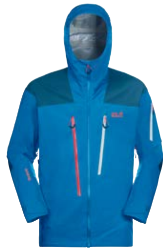
Jack Wolfskin ♂ SOLITUDE MOUNTAIN JACKET M Material: 100 % Polyester. Material 2: 91 % Polyamid, 9 % Elasthan. 1230070 449,95 €

Gemeinsam mit Felix Neureuther hat Jack Wolfskin eine nachhaltige Wintersportkollektion entwickelt.